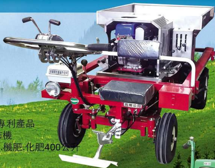
SH-49G 專利產品 乘坐式撒佈機 7.5HP石灰.機肥.化肥400公升