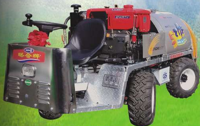
SH-60.S 風扇直徑550mm *可另行選購雙層風箱導流板.半圓藥桶