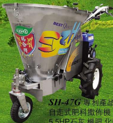
SH-47G 專利產品 自走式肥料撒佈機 5.5HP石灰.機肥.化肥120公升