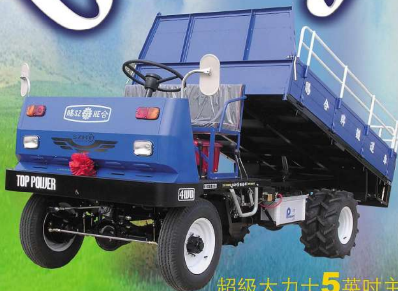
超級大力士5英吋主樑 SH-40DSL 六速 *可另行選購 油壓傾卸 *頂蓬與玻璃擋風板 *油壓尾門升降