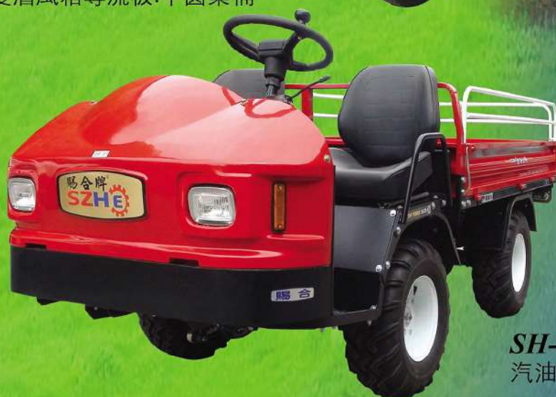
SH-38G 專利產品 汽油12HP改良型搬運車