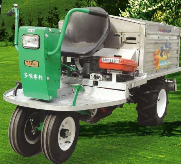
SH-159D 專利產品 16HP乘坐式打碎機